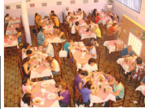
...o amplo, requintado e aconchegante espaço Casa da Mama.