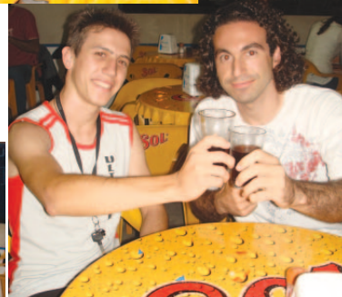
...clientes cativos da Casa, os amigos Andersons: "...adoramos os lanches do Novo Well!"