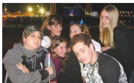
Com alguns dos amigos do Objetivo.