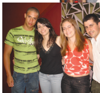
...ambiente lotado no domingo com o melhor da música ao vivo.