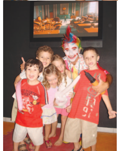
...novidade: o melhor dos shows e esportes, exibidos num supertelão.