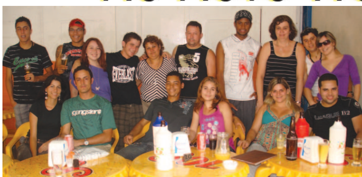
...na confraternização do amigo secreto, o pessoal das Lojas ED+, ao sabor de variados lanches e porções e aquela cerveja geladinha.